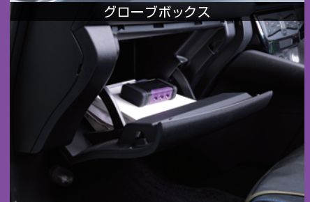
グローブボックス