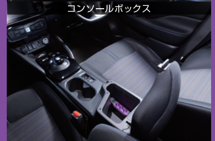
コンソールボックス